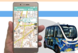
境町版 MaaSアプリ導入事業